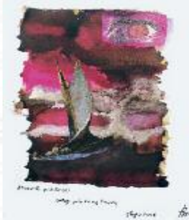
dipinto di Tito Maniacco

Tito Maniacco (Poesie sparse inedite (2006-7))